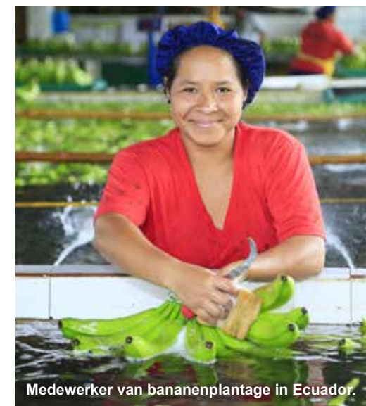
Medewerker van bananenplantage in Ecuador.